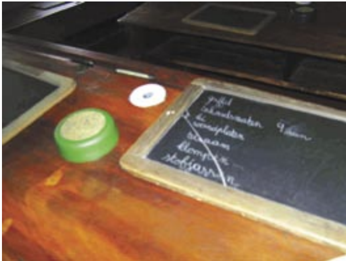
Schrijven op de lei

Vooraf voor oefeningen die niet bewaard hoefden te worden, werden nog steeds lei en griffel gebruikt. Om de lei schoon te maken gebruikten de leerlingen een spons. Met een zeempje maakten ze de lei weer droog. Spons en zeem zaten in een sponzendoosje. Bij het klassikaal lesgeven maakte de onderwijzer gebruik van het zwarte schoolbord, dat voor het eerst in de scholen verscheen.